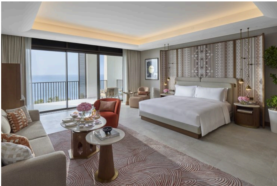
L'une des 47 suites de l'hôtel, avec vue mer

Dans les 103 chambres et 47 suites, allant de 94 à 312 m 2 , conçues par le designer français Xavier Carton, la touche omanaise est omniprésente : têtes de lit inspirées du Kuma (chapeau traditionnel), lanternes en laiton rappelant le Khanjar (poignard emblématique), bois de frêne, marbre Rose du Désert. Traditions, artisanat local, luxe et confort forment ici une harmonie parfaite, le tout accompagné de ces vues imprenables sur la plage de Shatti Al-Qurum ou les majestueuses montagnes Hajar.