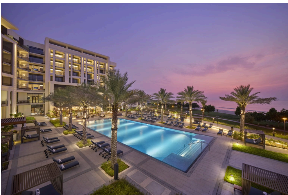
Mandarin Oriental, Muscat