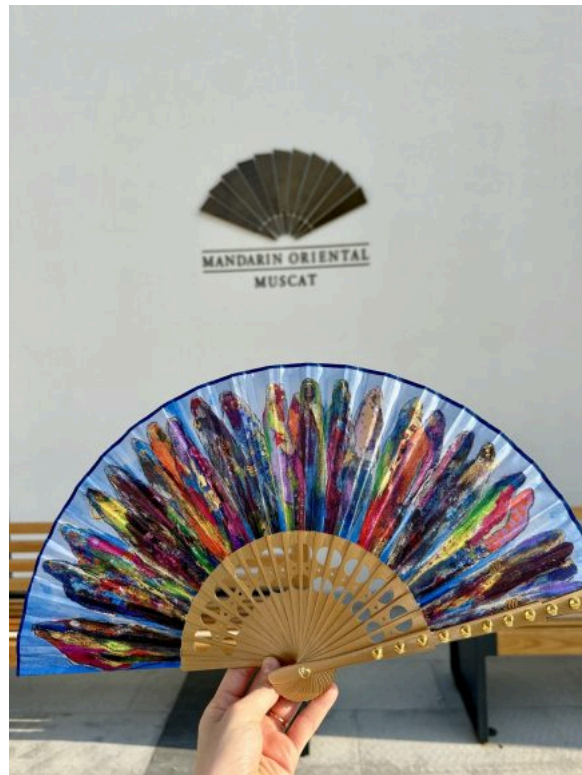
Le fan du Mandarin Oriental, Muscat est inspiré par la riche histoire du Sultanat – SE

Dès l'entrée, le décor est planté. D'immenses portes en bois sculpté s'ouvrent sur un lobby baigné de lumière, où trône l'indispensable fan (éventail), emblème des hôtels Mandarin Oriental, et qui sera également placé dans chaque chambre dans une version à emporter avec soi. Cette pièce, imaginée par l'artiste omanaise Alia al Farsi, raconte l'histoire du Sultanat à travers les onze gouvernorats du pays, chacun illustré à travers les traditions et costumes de ses habitantes. Chaque détail de l'éventail est pensé comme une narration de l'histoire et de l'âme du pays : le bâton s'inspire du Mashwak, bijou délicat porté par les femmes au poignet, les motifs circulaires au centre du tissage rendent hommage au Mafraq, un autre bijou omanais, et le bois de Shirish utilisé pour l'encadrement évoque les paysages locaux.