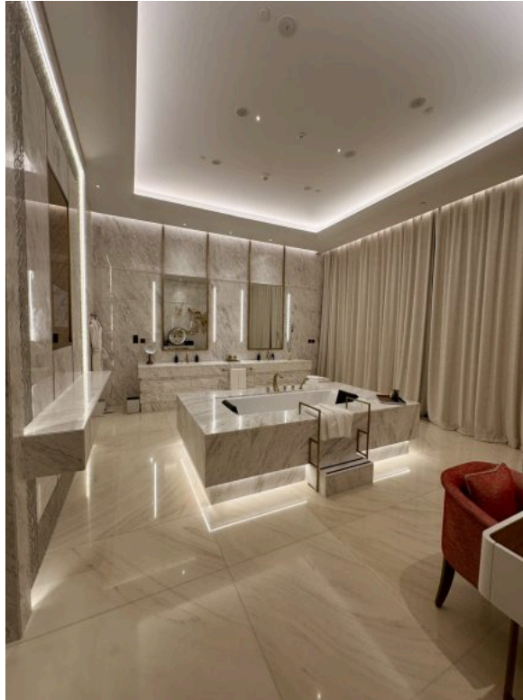
L'immense salle de bain de la Royal Suite – SE