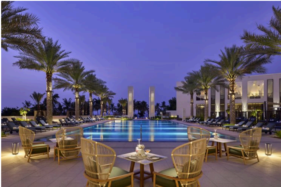
La vue depuis Rawya, l'un des trois restaurants de l'hôtel